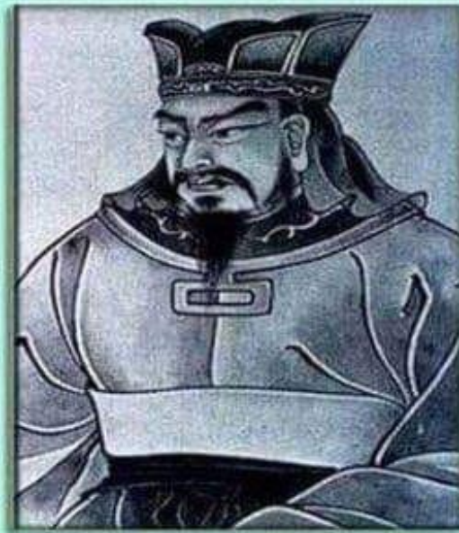
Sun Tsu 500 v.Z.

Zersetzt, was immer im Land eurer Feinde gut ist. Macht ihre Werte lächerlich. Zerrt sie in den Dreck. Verbreitet Streit und Uneinigkeit unter den Bürgern. Stachelt die Jugend gegen die Alten auf.