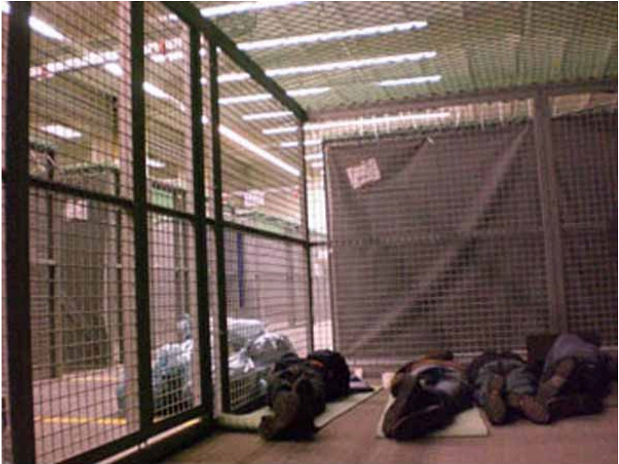
Guantanamo-Käfige beim G8-Gipfel in Heiligendamm 2007 für festgenommene Demonstranten...

Wir brauchen einen Corona Untersuchungsausschuss Neusprech in der postdemokratischen BRD Bei Quarantäne auf der Flucht erschossen?