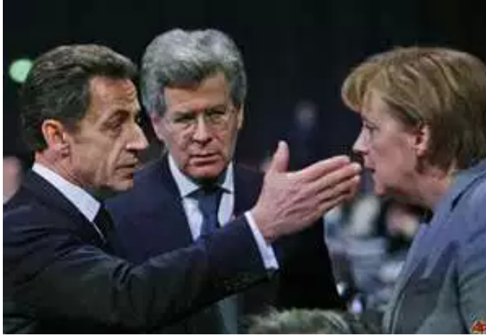
Der Jude Sarkozy (links), ehemaliger Präsident Frankreichs mit dem Büttel Angela Merkel, Kanzlerin der BRD (rechts)

„Der Mensch der fernen Zukunft wird Mischling sein. Die heutigen Rassen und Kasten werden der zunehmenden Überwindung von Raum, Zeit und Vorurteil zum Opfer fallen. Die eurasisch-negroide Zukunftsrasse, äußerlich der altägyptischen ähnlich, wird die Vielfalt der Völker durch eine Vielfalt der Persönlichkeiten ersetzen.“ (22-23)