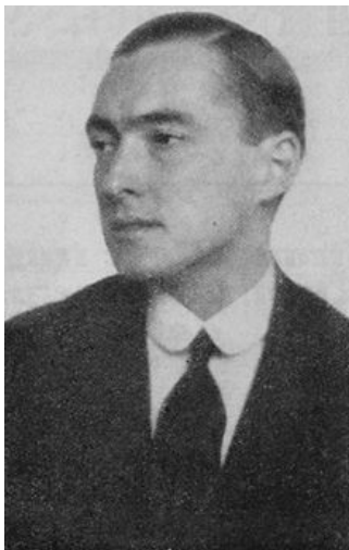
Der Mischlingsjude Kalergi, selbsternannter Exponent der „geistigen Führerrasse“ einer

Im Jahr 1924 gründete Coudenhove-Kalergi die Paneuropa-Union, die älteste europäische Einigungsbewegung. Im Lauf der Zeit gehörten dieser Albert Einstein, Thomas Mann und Otto von Habsburg ebenso an wie Spitzenpolitiker wie Konrad Adenauer, der französische Außenminister und Friedensnobelpreisträger Aristide Briand, der tschechoslowakische Außenminister Edvard Beneš und der französische Ministerpräsident Edouard Herriot. Die österreichische Sektion führten der damalige Bundeskanzler Karl Renner und dessen Stellvertreter Ignaz Seipel an. Coudenhove-Kalergi war damit Vordenker der heutigen europäischen Idee und des europäischen Selbstverständnisses und der europäischen Identität. Prinzipien eines Europa im Sinne Coudenhove-Kalergis waren Freiheit, Frieden, Wohlstand und Kultur, die noch heute das Selbstverständnis Europas kennzeichnen.